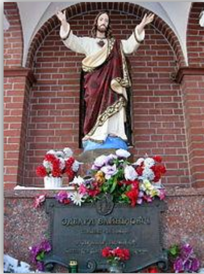
Месца пахавання Э. Вайніловіча ля Чырвонага касцёла

Праз 78 год з Польшчы ў Беларусь перавезлі астанкі Эдварда Вайніловіча і пахавалі ў нішы Чырвонага касцёла. Нарэшце было выканана яго апошняе жаданне, якое ён выказаў перад смерцю.