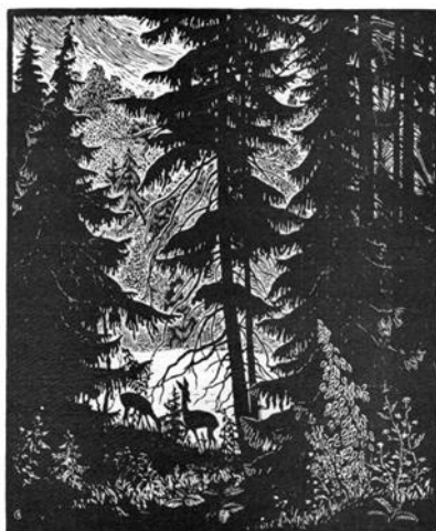
Косули. Беловежская пуца. 1960