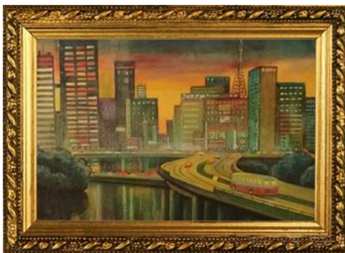
Япония. Ночное Токио