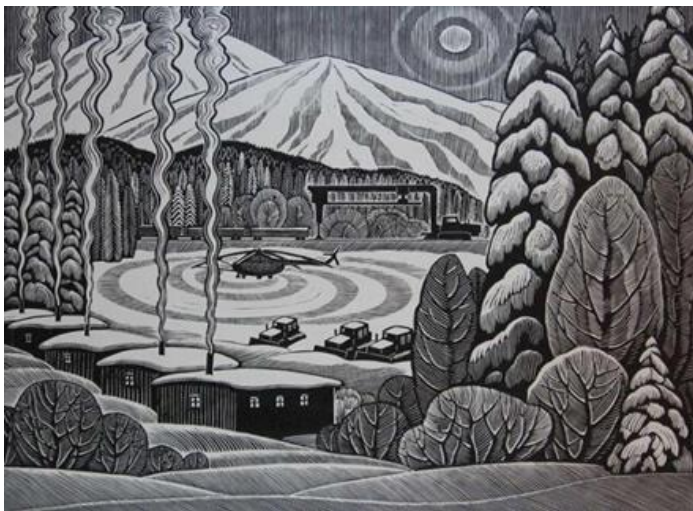
Зима на БАМе. Утро. 1979

Земля белорусская - неисчерпаемый источник вдохновения художника. «Лебеди летят», «Утро в Беловежской пуще», «Косули» и другие работы из серии «Белорусское Полесье» не могут оставить зрителя равнодушными, поскольку созданы человеком, влюбленным в свой край, его неброскую красоту, особую внутреннюю гармонию. В творчестве художника важной темой является индустриализация. Работа геологов, калийщиков, нефтяников вдохновила мастера на создание серии линогравюр «Беларусь индустриальная».