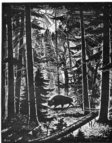
Утро в Беловежской пуце. 1963