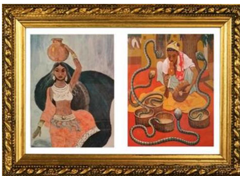
Индия. Заклинатель змей