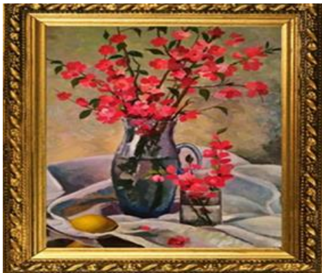
Крым. Японская айва

«Море в солнечный день», которые завораживают гармонией красок южной природы.