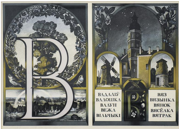
У. Басалыга. "Мова наша родная"