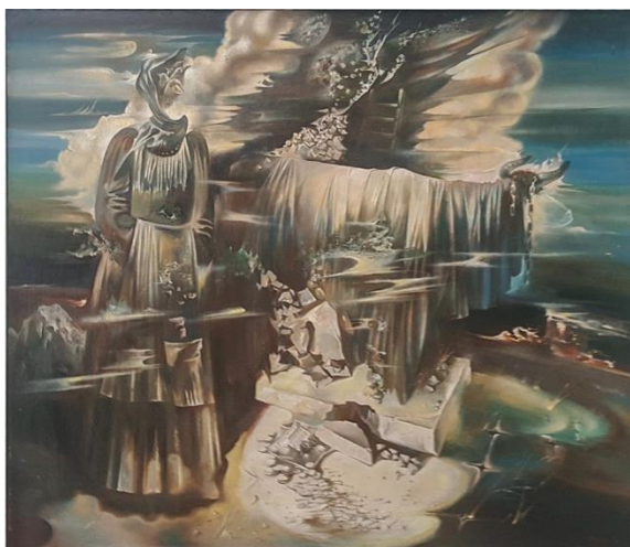
А.Марачкін. "Планета Палын".

Паходжаннем мастак вясковец з Магілёўшчыны. Ён належыць да таго пакалення, што мела магчымасць атрымаць прафесійную адукацыю не ў Маскве ці ў Піцеры, а на радзіме. Я маю глыбокую павагу да гэтых цэнтраў культуры, але трымаюся думкі, што нацыянальная мастацкая школа мусіць грунтавацца на мясцовых рэаліях, што беларускаму мастаку лепей вучыцца дома. А за мяжой, калі будзе на тое патрэба — удасканальваць базавыя веды і прафесійныя навукі, набытыя ў родных сценах. Прытым, што з кожнага правіла могуць быць выключэнні.