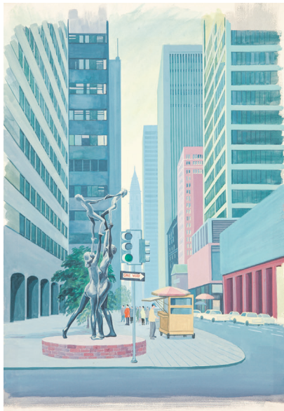
«Плошча Філадэльфіі», 1987 г.