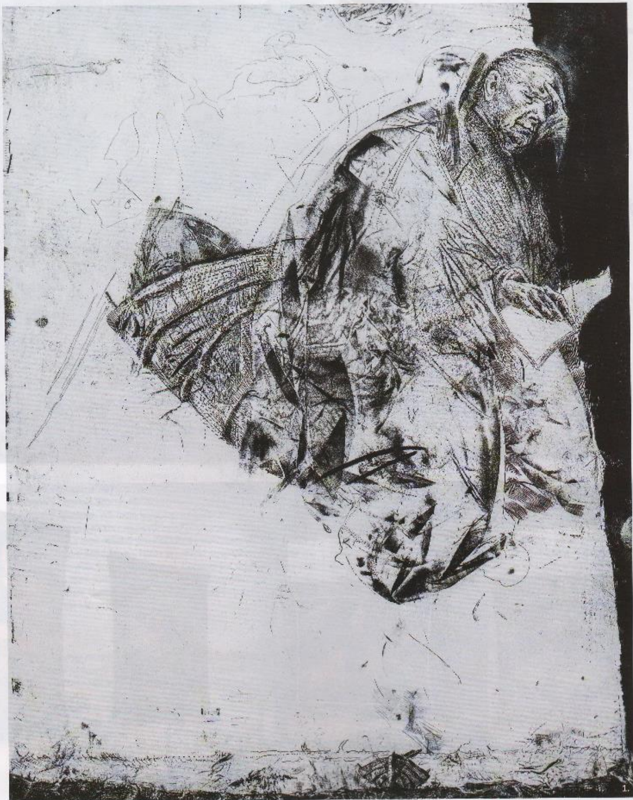
«НАСТУПСТВА» № 32 (453)