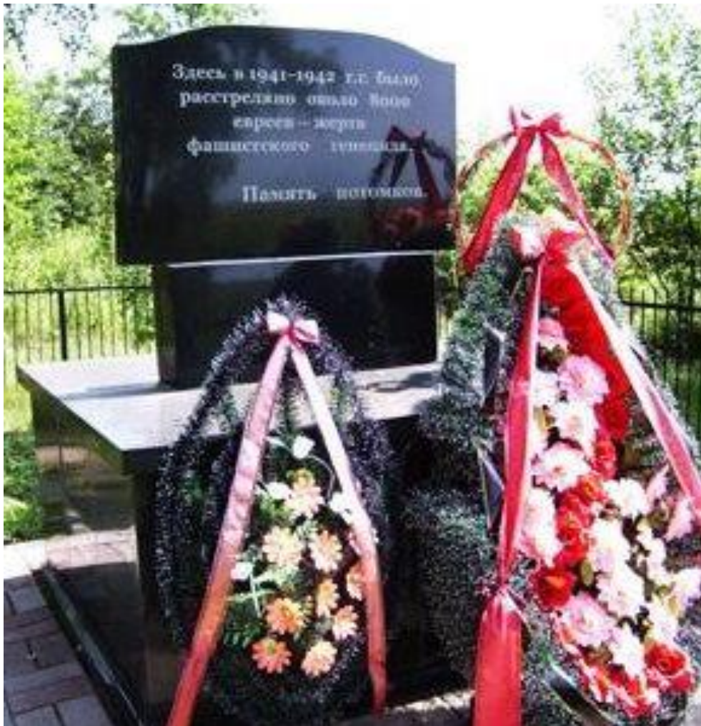
Обелиск на братской могиле жертв фашизма д. Селище, урочище «Гореваха».

На Слутчине помнят то страшное время и чтут память безвинно погибших. Сегодня напоминанием всем о Холокосте являются памятные места и установленные памятные знаки, как символы трагедии еврейского народа в годы Великой Отечественной войны.