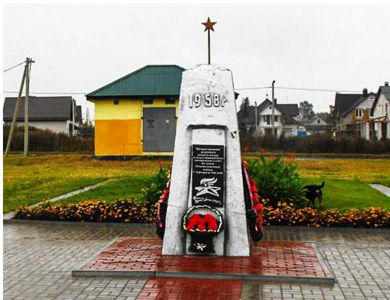
Могила жертв фашизма (место расстрела 3 тыс. мирных жителей), ул. Монахова.