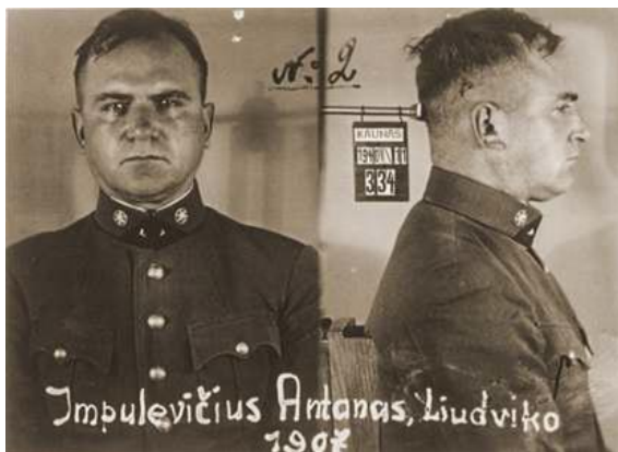
Антанас Импулявичус, глава 12-го литовского охранного батальона.

Утром 27 октября 1941 г. в Слуцк прибыл 12-ый литовский полицейский охранный батальон под руководством майора Антанаса Импулявичуса.