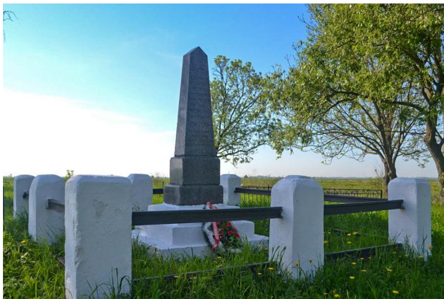
Обелиск на братской могиле жертв фашизма. Берег реки Весейка (более 3 тыс. человек, расстрелянных в феврале 1943 года), урочище Мохарты.