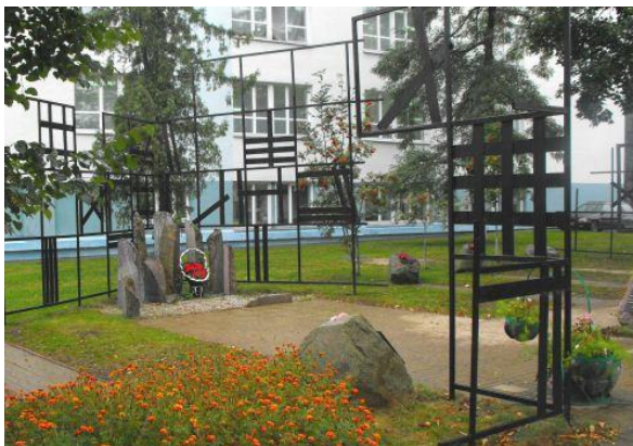
Мемориальный знак жертвам Слуцкого гетто.

По словам Леонида Левина, автора памятника, известного архитектора, он стремился создать образ замкнутого пространства, куда были согнаны тысячи людей, оказавшихся в безвыходном положении. «Они были загнаны в угол и столкнулись с теми ужасами, которые переживает человек перед лицом неминуемой мучительной смерти. Людей не просто убивали: их сжигали, как сжигают дрова. Установленные в углах комплекса камни и символизируют судьбы этих людей. Количество их в каждом углу — десять, поскольку по национальной традиции читать священную книгу Тору евреи могут, если их не меньше десяти.»