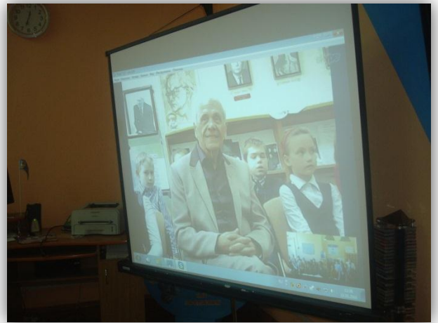
У прэзентацыі кнігі В. Віткі “Сонечны чараўнік” прынялі ўдзел пісьменнік У. Ліпскі і юныя чытачы г. Мінска

знакамітым майстрам слова падарыла дзецям шмат станоўчых эмоцый і дала ім магчымасць прадэманстраваць свае таленты. Юныя случчане і іх аднагодкі з Мінска пагутарылі з пісьменнікам, задалі яму пытанні, прачыталі вершы нашага пісьменніка-земляка.