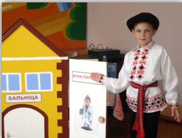
У час спектаклю

Хвілінкі-весялінкі “Дзедаў карабец” для дашкольнікаў і малодшых школьнікаў выліліся ў вясёлае свята дзяцінства. У мерапрыемствах узялі ўдзел супрацоўнікі Установы “Рэдакцыя часопіса “Вясёлка”. Дзіцячы аддзел бібліятэкі агарнуў дзяцей атмасферай цяпла, утульнасці і чараўніцтва. Падчас займальнага конкурсаў, гульняў, забаўлянак дзеці атрымалі як новыя пазнанні аб любімым часопісе, так і шмат станоўчых эмоцый.