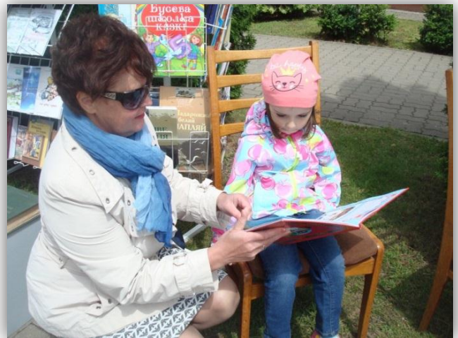
...а можна чытаць з бібліятэкарам