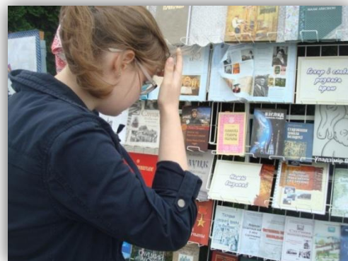
Краязнаўчая выстава на бібліятэчным дварыку прыцягвае ўвагу мінакоў

Слайд-прэзентацыя «Палёт скрозь стагоддзі» пазнаёміла ўсіх прысутных з геаграфічнымі і гістарычнымі мясцінамі нашай краіны. Кніжная экспазіцыя “Гонар і слава роднага краю”, гульня-падарожжа “Урокі роднага слова», літаратурны гасцінец “Я слова заповітнага шукаў”, шэраг конкурсаў дапамаглі дзецям глыбей акунуцца ў багатую на падзеі беларускую зямлю. Для нас віртуальная акцыя “Падарожжа з Васем Вясёлкіным па Беларусі” – дадатковая нагода звярнуць увагу на сваю работу ў накірунку папулярызацыі беларускай літаратуры, краязнаўства, яшчэ адзін падарунак горада.