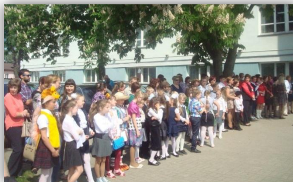
У Чытаннях на Случчыне штогод прымаюць удзел каля двух тысяч чалавек