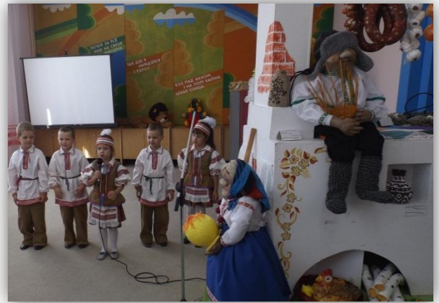
Дашкаляты – сапраўдная аздоба свята

Хвілінкі-весялінкі “Дзедаў карабец” для дашкольнікаў і малодшых школьнікаў выліліся ў вясёлае свята дзяцінства. У мерапрыемствах узялі ўдзел супрацоўнікі Установы “Рэдакцыя часопіса “Вясёлка”. Дзіцячы аддзел бібліятэкі агарнуў дзяцей атмасферай цяпла, утульнасці і чараўніцтва. Падчас займальнага конкурсаў, гульняў, забаўлянак дзеці атрымалі як новыя пазнанні аб любімым часопісе, так і шмат станоўчых эмоцый.