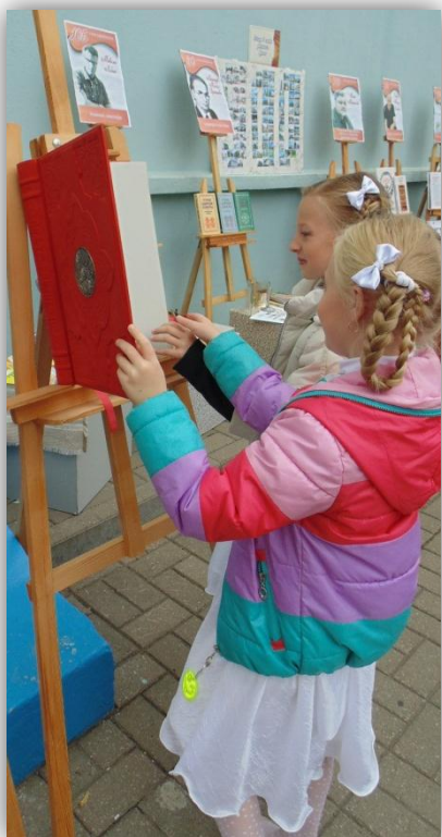
Слуцкае Евангелле - нацыянальная праваслаўная святыня

Мерапрыемствамі былі ахоплены шасцікласнікі з усіх школ горада. Віртуальнае падарожжа змясціла ў сябе шматлікія мерапрыемствы і акцыі.