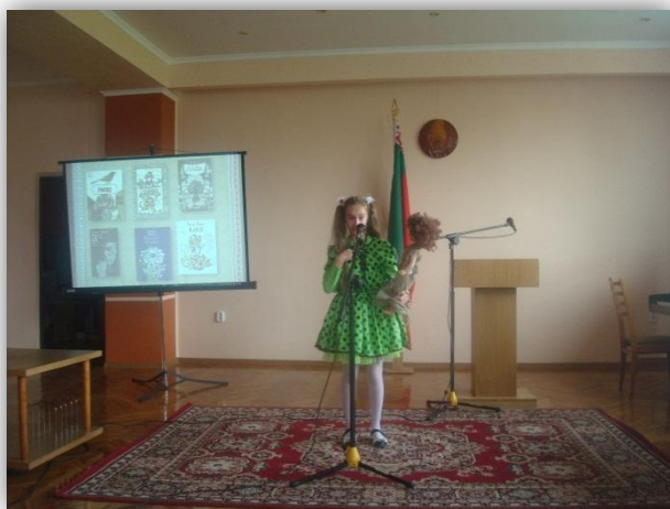
У час конкурса “Жыў на свеце дзед Васіль”

Гледачы атрымалі сапраўдную асалоду ад выканальніцкага майстэрства юных артыстаў і ўдзельнікаў конкурсу чытальнікаў.